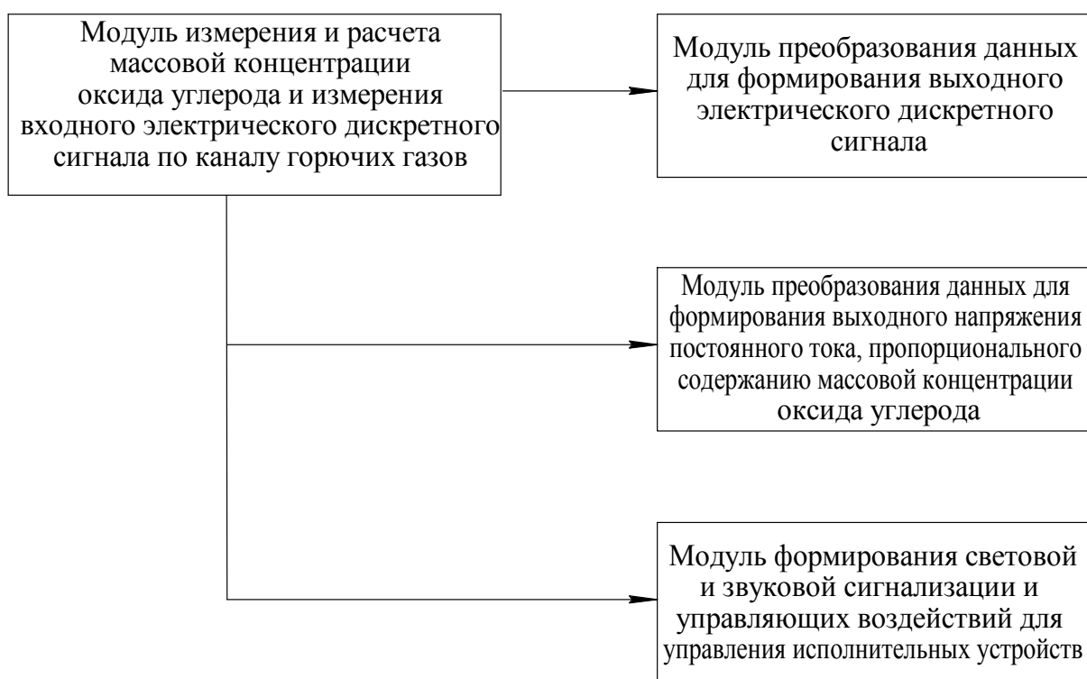
Рисунок 3 - Структура ПО.