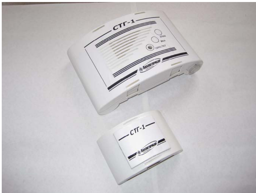
Рисунок 1– Внешний вид сигнализаторов

Внешний вид сигнализаторов показан на рисунке 1.